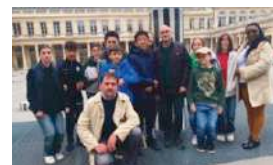
LE KT À PARIS