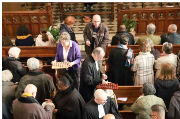
La cène, un lien d'amour assurément...

Nous sommes un dans un lien d'amour avons-nous chanté le 26 novembre dernier à Moulins. Ce cantique tiré d'un verset de l'épître aux Colossiens (3, 14) nous dit bien plus que ses paroles un peu naïves pourraient le laisser croire. D'abord car, si c'est bien le cas – si nous sommes effectivement dans un lien d'amour – ce n'est rien de moins qu'avec l'Esprit de Dieu que nous sommes unis. Or, qui contesterait que le but de toute vie chrétienne soit d'être, un